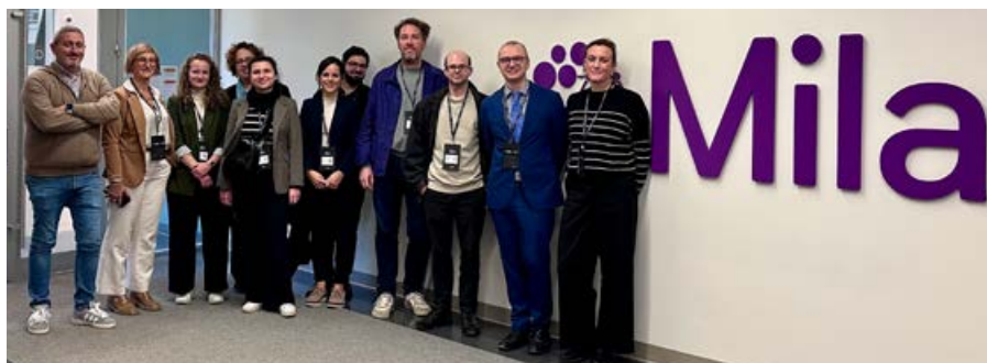
Rencontre de travail au MILA

Du 15 au 18 octobre 2024, des expertes et experts wallons du numérique sont venus prendre le pouls de l'innovation lors de <MTL> connecte, dans le cadre d'une mission organisée par la Délégation générale Wallonie-Bruxelles au Québec/Canada et Wallonie-Bruxelles International - Recherche et Innovation.