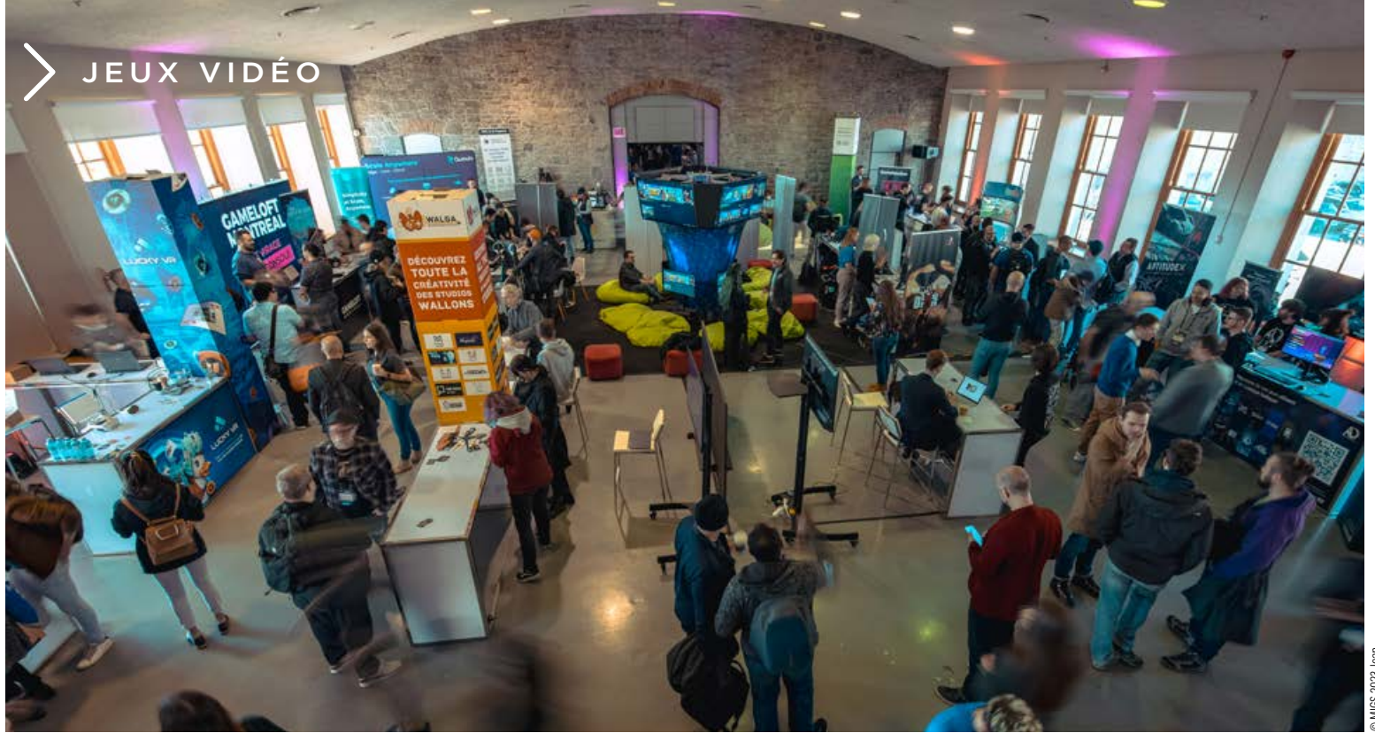
WALGA au Sommet international du jeu de Montréal (MIGS)