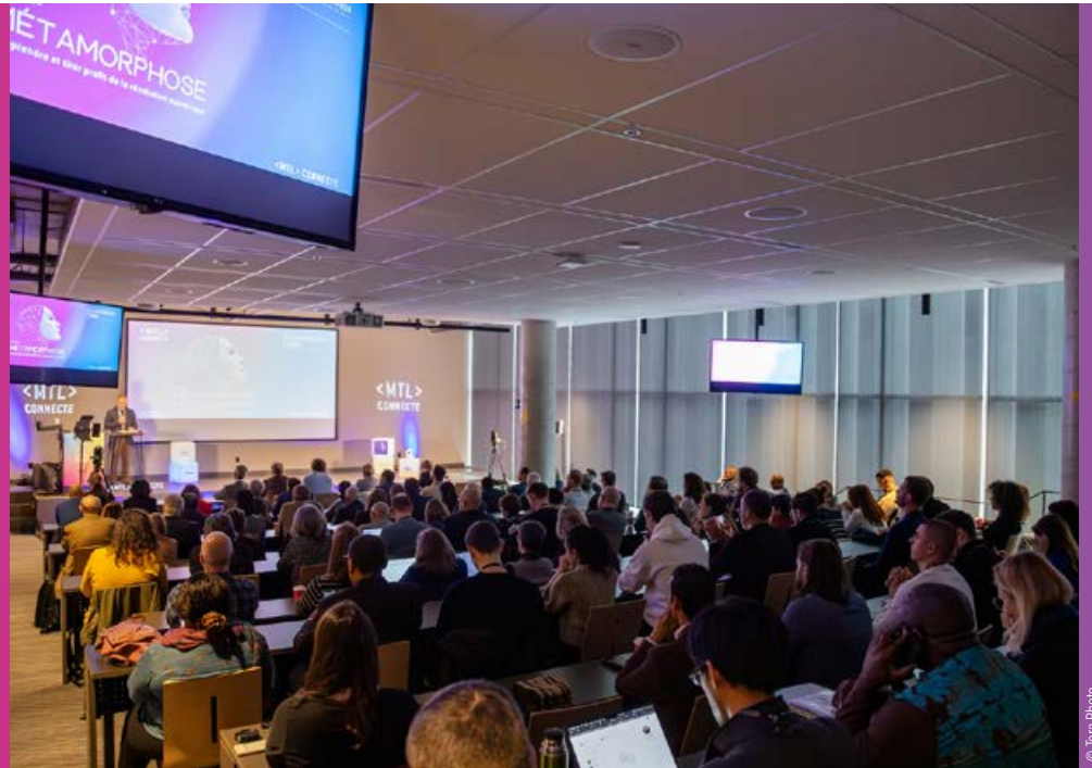
Ouverture de la 6 e édition de connecte (octobre 2024)

Comme chaque année depuis 2019, plusieurs entreprises wallonnes se retrouvent au Québec à l'occasion de <MTL> connecte. Orchestré par le Printemps numérique, l'événement est rapidement devenu un incontournable pour le bureau de l'Agence wallonne à l'Exportation et aux Investissements étrangers (AWEX) de Montréal qui y est fidèle, depuis sa création.