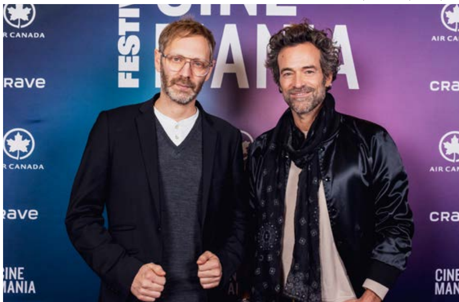
Le réalisateur Guillaume Senez et le comédien Romain Duris venus présenter Une part manquante