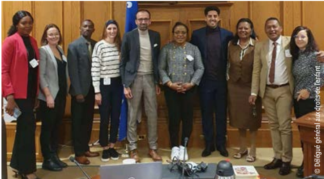
Quelques membres du congrès de l'AOMF à Québec