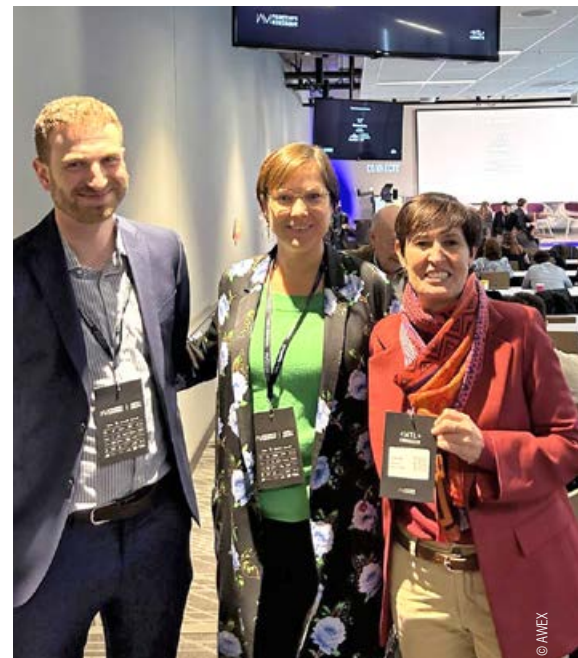
L'équipe montréalaise de l'Agence wallonne à l'Exportation et aux Investissements étrangers (AWEX)

Les entreprises wallonnes ont également pu compter sur le soutien de l'équipe AWEX de Montréal, qui a organisé pour elles une série de rendez-vous personnalisés avec des acteurs locaux, favorisant ainsi les échanges et les opportunités de collaboration.