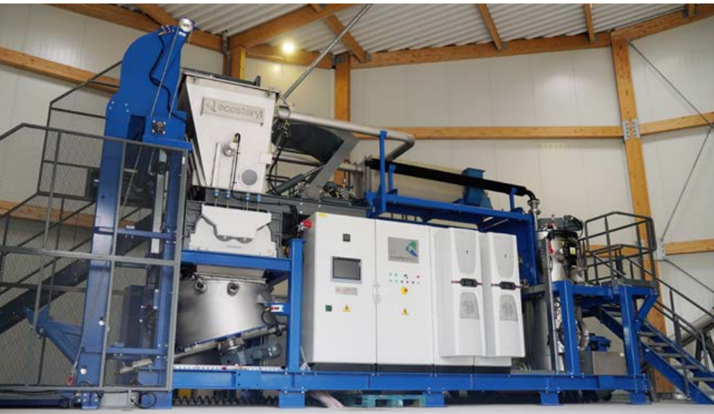
L'Ecosteryl 250, conçue pour le traitement durable des déchets médicaux infectieux