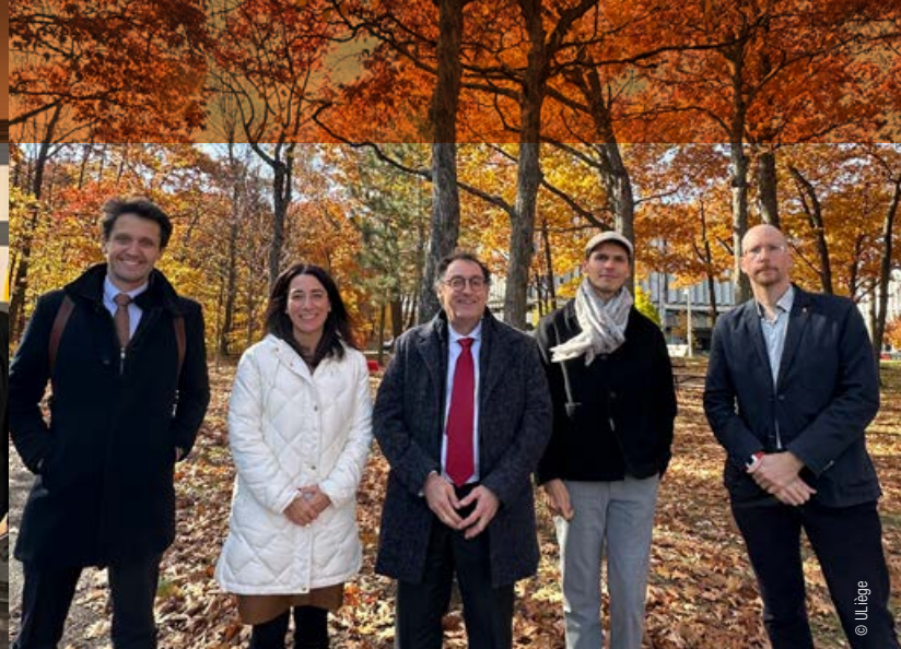
Visite de la délégation liégeoise à l'Université Laval