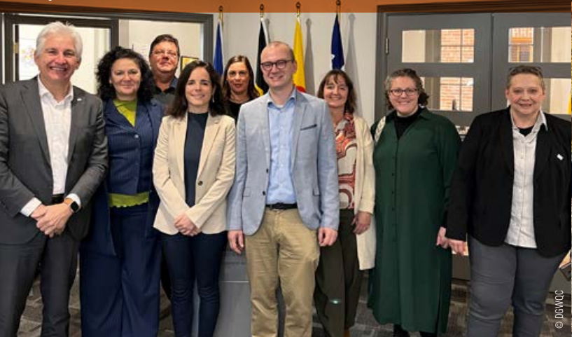
Les représentants de l'UMONS dans les bureaux de la Délégation générale Wallonie-Bruxelles au Québec/Canada